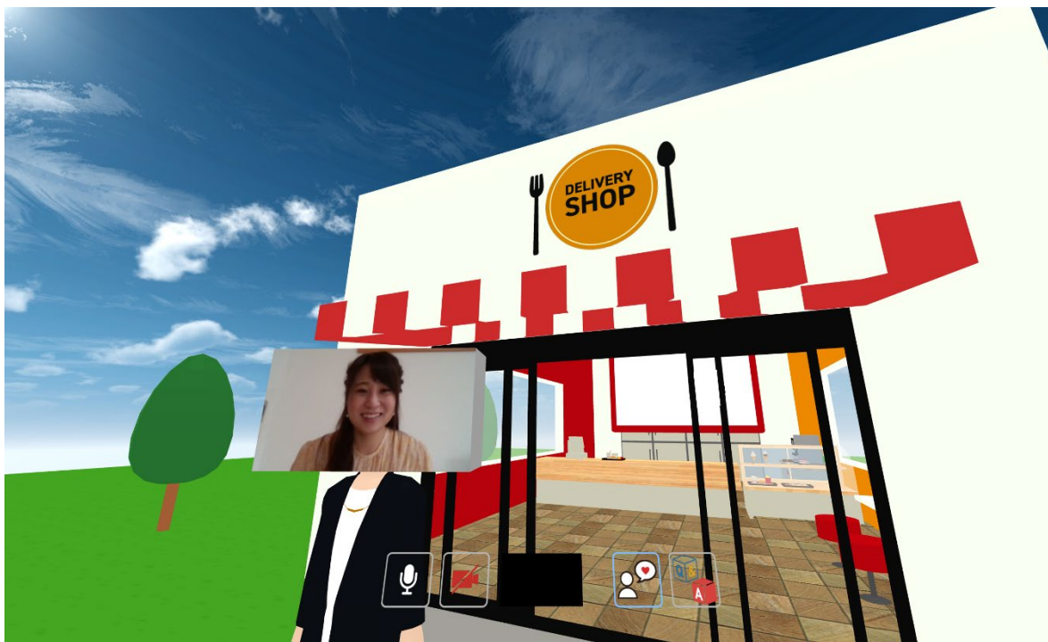
※お店のVR空間を楽しんでいるイメージ画像

VRルームの無償提供はメタバース推進の一環で行われるもので、まだ一般的でないVRを1人でも多くの人に楽しんでもらう為に企画したものです。